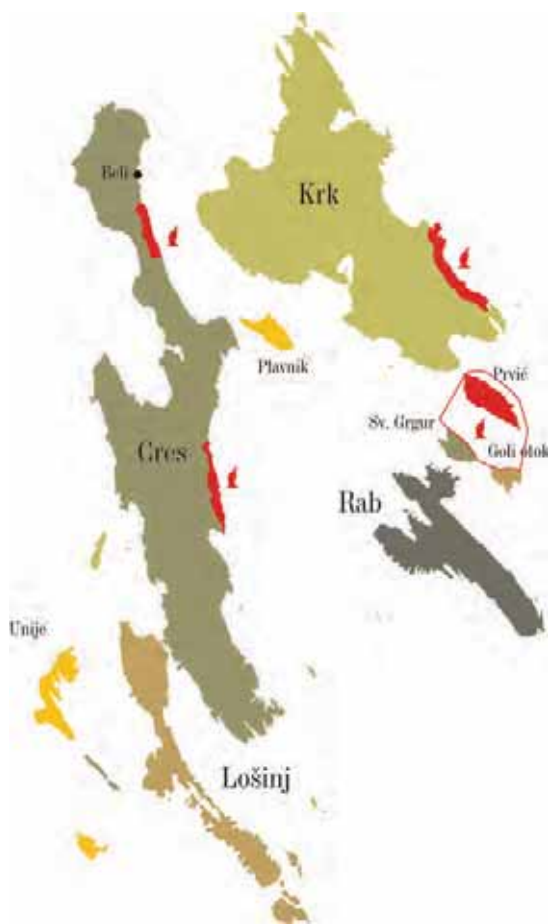
Posebni ornitološki rezervati proglašeni prvenstveno radi zaštite gnijezdeće populacije bjeloglavih supova.

letovima uslijed uznemiravanja, mogu pasti u more i utopiti se. Zbog učinkovitije zaštite bjeloglavih supova, u mjestu Beli na Cresu 1993. je osnovano oporavilište za bjeloglave supove u sklopu Eko-centra "Caput-insulae", odnosno istoimene udruge pod vodstvom dr. sc. Gorana Sušića, koje je djelovalo do kraja 2012. godine. Oporavilište je najvećim dijelom prihvaćalo upravo iscrpljene mlade supove pronađene podno litica kvarnerskih rezervata koji su nakon oporavka, puštani na slobodu. Eko-centar "Caput insulae", djelujući u domeni neposredne zaštite prirode, pružao je u isto vrijeme i jedinstven turističko-edukativni sadržaj za domaće i strane posjetitelje. Prestanak aktivnog djelovanja Eko-centra kao i premještanje oporavilišta za supove na područje Grada Senja, rezultirao je gubitkom specifičnog otočnog sadržaja, koji je u godinama svog postojanja dodatno "brendirao" otok Cres kao područje izuzetnih prirodnih vrijednosti i bogate kulturno povijesne baštine. Primorsko-goranska županija, u suradnji s Gradom Cresom, inicirala je u veljači 2014. godine aktivnosti u cilju ponovnog uspostavljanja oporavilišta za bjeloglave supove na istoj lokaciji. Novo osmišljeni Centar za posjetitelje – Beli, službeno je otvoren u srpnju 2016. godine, a za nositelja i koordinatora svih aktivnosti