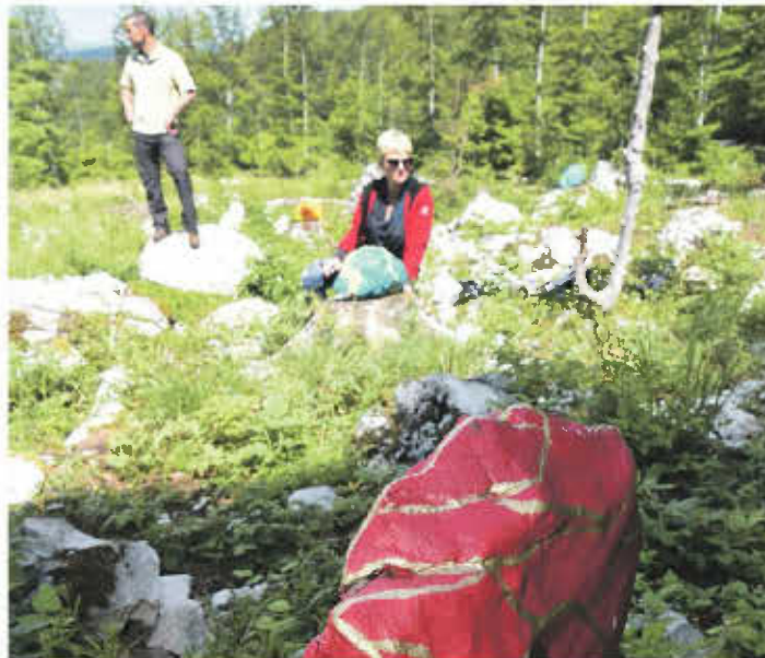
I radove na Land Art stazi na Učki vrijedi vidjeti

čin na koju je održavamo i uređujemo okoliš i odvedemo ih do teško dostupnih lokaliteta, ali i na proplanke s kojih se pružaju predivni pogledi. Najčešće ih vodimo na kulu na Vojak, zatim prema jugu na proplanak s kojeg se vidi Istra. Nastavljamo šumskom cestom do lokacije s koje se vidi Čepičko polje koje je nekad bilo jezero, a koje je u doba Mussolinijeve vladavine isušeno, tako da im prenosi-