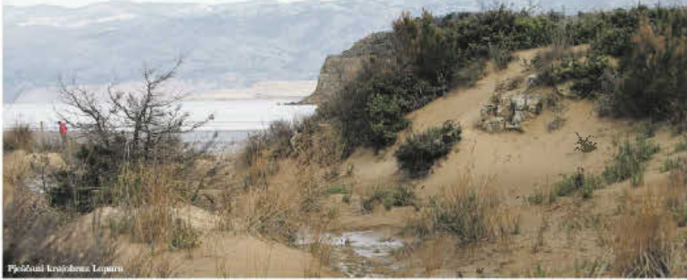
PP Šumski krajobrazna Lopar