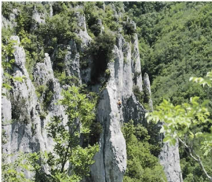
Vela Draga, jedinstveni geomorfološki fenomen

prodaje kao program "Provedi dan s renderom". Riječ je o atraktivnom programu upoznavanja manje poznatih i teže dostupnih lokaliteta na Učki koju nudi JU PP Učka. Program se provodi oko sedam godina, a najčešće ovakvu turističku ponudu, kaže naš domaćin, prihvaćaju strani državljani.